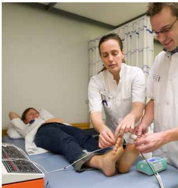
Måling af blodtryk på ankel- og tåniveau.

Derudover er vi aktuelt ved at undersøge en anden lovende ny metode kaldet laser Doppler pletysmografi til måling af blodtryk på ankel- og tåniveau. Metoden er