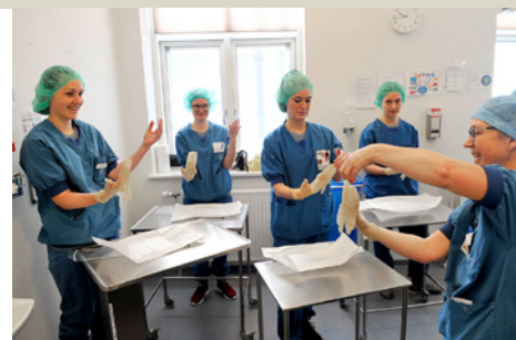
Center for Planlagt Kirurgi har udviklet et nye koncept for kompetenceudvikling af sygeplejersker.

Workshop i virkeligheden er inddelt i syv temaer: Situationsbestemt kommunikation, klinisk lederskab, klinisk beslutningstagen, steril teknik/aseptik, huddesinfektion, medicin og kateteranlæggelse.