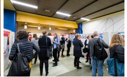
Arkivfotos fra Sundhedsfagligt Symposium sidste år.

Torsdag den 22. november er det sundhedsfagenes festdag på HE Midt. Her løber det årlige arrangement Sundhedsfagligt Symposium af stablen for det sundhedsfaglige personale på hospitalerne i Viborg, Silkeborg, Hammel og Skive.