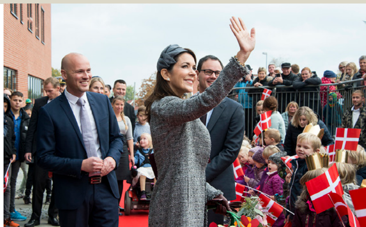
Kronprinsessen ses her til en anden indvielse i Region Midtjylland på Regionshospitalet Randers i 2016.

Læs mere om familiehuset og indvielsen på hjemmesiden.